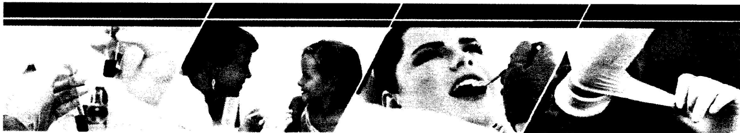
Табл. 37 (195, 196 и 197)